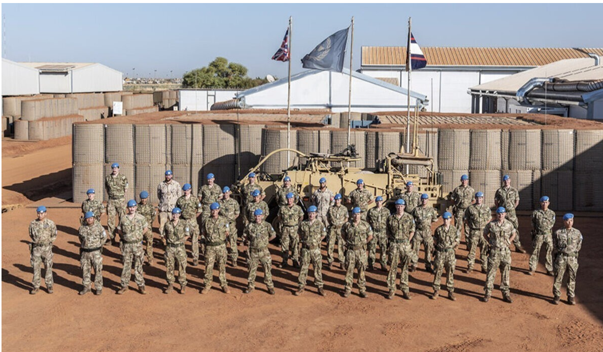
Foto – Rinforzi dal Regno Unito per la missione MINUSMA (21 gennaio 2021)

– Il ritiro francese dal Mali è stato da alcuni descritto come una sconfitta di Macron paragonabile a quella di Biden in Afghanistan. La decisione francese corrisponde di fatto a un disimpegno europeo nella zona