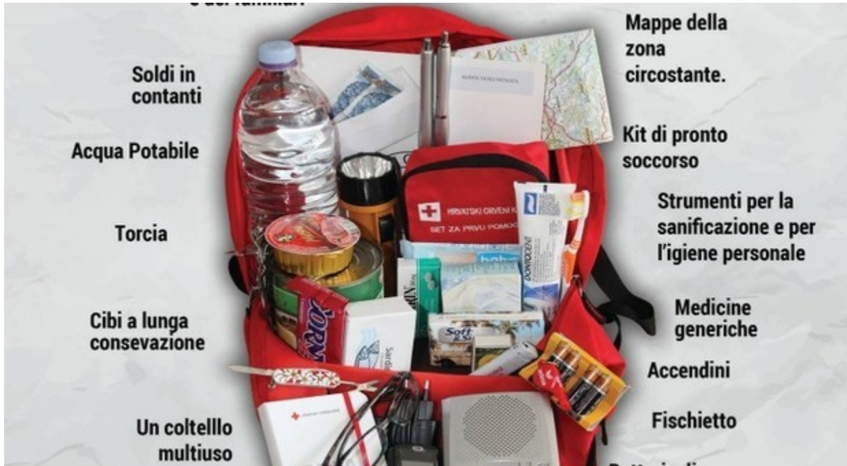
Foto – Kit di sopravvivenza

– Sì, è così. Se si spera di scappare dalla civiltà in fiamme soltanto con uno zainetto pieno di attrezzi da campeggio, qualche barattolo di cibo e un revolver carico, ci si sbaglia di grosso. Potremmo fare un paragone con la guerra greco gotica del VI secolo – il periodo peggiore che la nostra Penisola abbia mai sofferto. Caduto l'impero romano, instauratisi i Goti, guerra totale coi bizantini per quasi 20 anni, e in aggiunta carestie, devastazioni, stragi e la micidiale pestilenza giustiniana. Il colpo finale fu l'invasione dei Longobardi. Ciò che restava dell'Italia erano 4 milioni di individui macilenti e abbattuti, ormai assoggettati ai dominatori barbari. All'epoca, di territorio libero e inabitato ce n'era tantissimo: le grandi ville romane abbandonate, i campi tornati ad essere selve, l'aria pulita... E pur essendo le persone capaci di vivere senza energia elettrica o acqua corrente, passarono una tragedia immane. Quanto riuscirebbe a resistere un uomo moderno... o persino il preparato dei survivalisti?